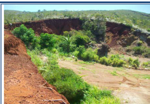
Emplacement du nouveau site de gestion