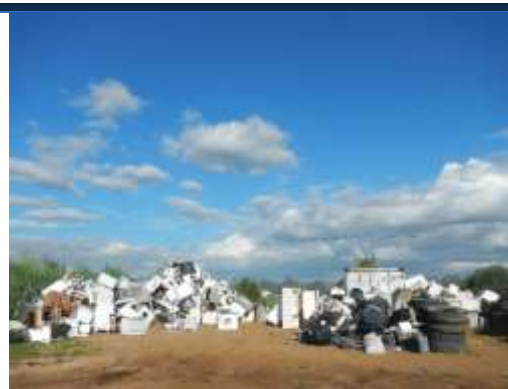
Stock de D3E