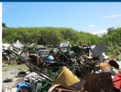
Site avant travaux