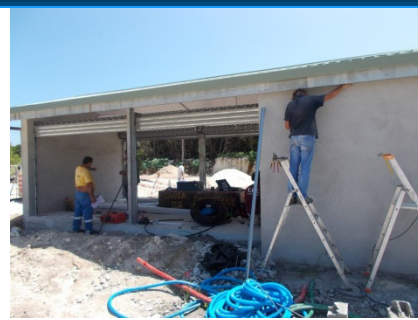
Local à déchets dangereux