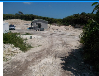
Site après terrassements